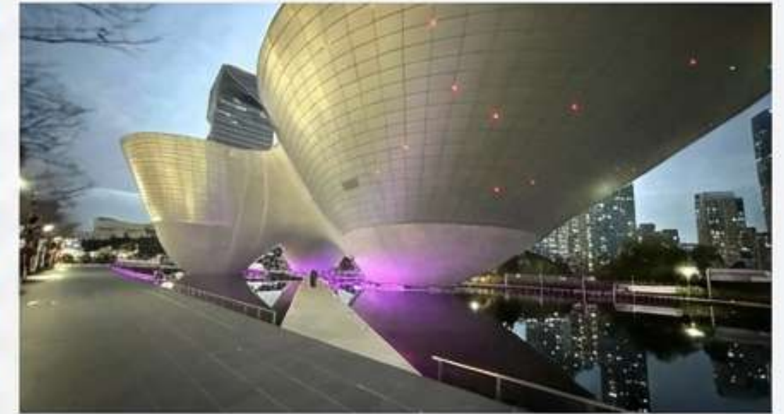
트라이볼 (인천 송도): 세계최초 역셀 구조 비정형 건축물. 송도의 랜드마크 (한국건축문화대상 수상)