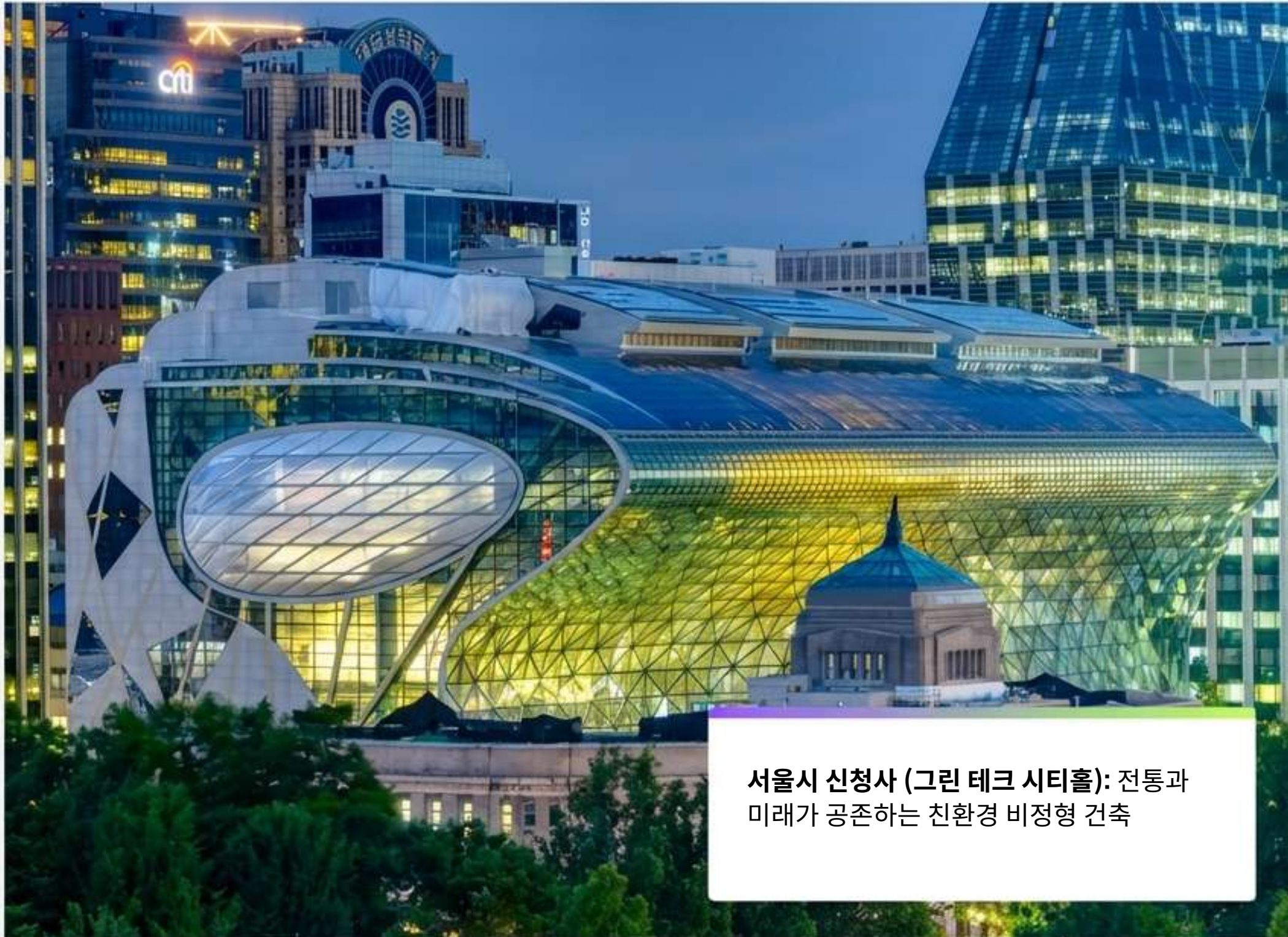
서울시 신청사 (그린 테크 시티홀): 전통과 미래가 공존하는 친환경 비정형 건축