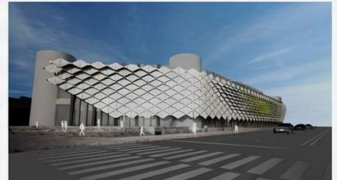
국립어린이과학관 (서울): 파사드디자인에 과학적원리와 미디어를 융합한 키네틱 건축물